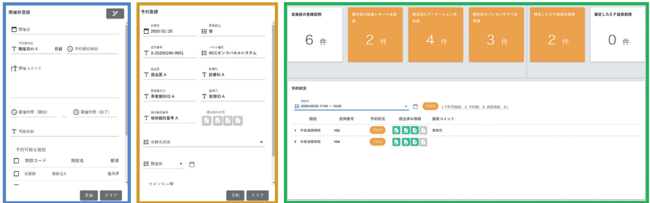
1. エキスパートパネル開催枠設定機能(中核拠点および拠点病院)